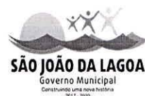
Tabela de Vencimentos Carreira de Agente Administrativo Carga horária: 40h/semanais